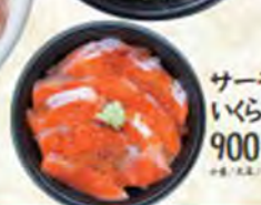
サーモンいくら丼