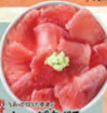
キハダまぐろ赤身丼