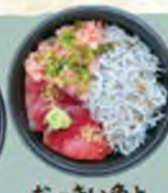
おっさい魚とちっさい魚丼