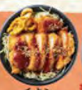
チキンソースかつ丼