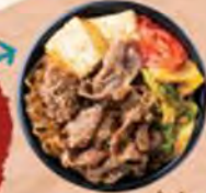
【南又特産】相州牛すき焼き丼